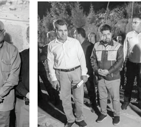
مدیر عالی پروژه مسیر پیاده‌روی و دوچرخه‌سواری کوهسار مهدی (عج)