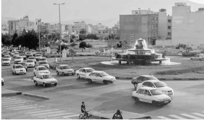
بلوار پاسارگاد شرقی

میدان پارسه در تقاطع بلوار پاسارگاد شرقی و غربی و بلوار باهنر جنوبی نقش بسیار مؤثری در هدایت ترافیک این قسمت از شهرداری منطقه چهار دارد. راست‌گرد این میدان از سمت بلوار پاسارگاد شرقی به بلوار باهنر جنوبی به دلیل مشکلات ناشی از تصادفات بیش از یک‌سال است که با دستور پلیس مسدود شده و تنها نقش این میدان در چپ‌گرد و عبور ترافیک از بلوار پاسارگاد غربی به شرقی و بلوار باهنر جنوبی باقی مانده بود. با توجه به گستردگی واحدهای تجاری، ورزشی، بوستان شقایق و واحدهای آموزشی در مجاورت بلوار پاسارگاد شرقی این محور بسیار پرتردد بوده و چپ‌گرد میدان پارسه و عبور جنوب به شمال این میدان نقش روان‌سازی ترافیک را به درستی ایفا می‌کرد. هر چند که بعضاً شاهد برخوردهای خیلی محدود خودروهای عبوری دور میدان در نتیجه تردد مستقیم از بلوار باهنر جنوبی در امتداد پل شهیدان غلامی و بلوار پاسارگاد غربی به شرقی آن هم به دلیل سرعت زیاد بودیم؛ اما بازهم میدان نقش مؤثری در عبور ترافیک