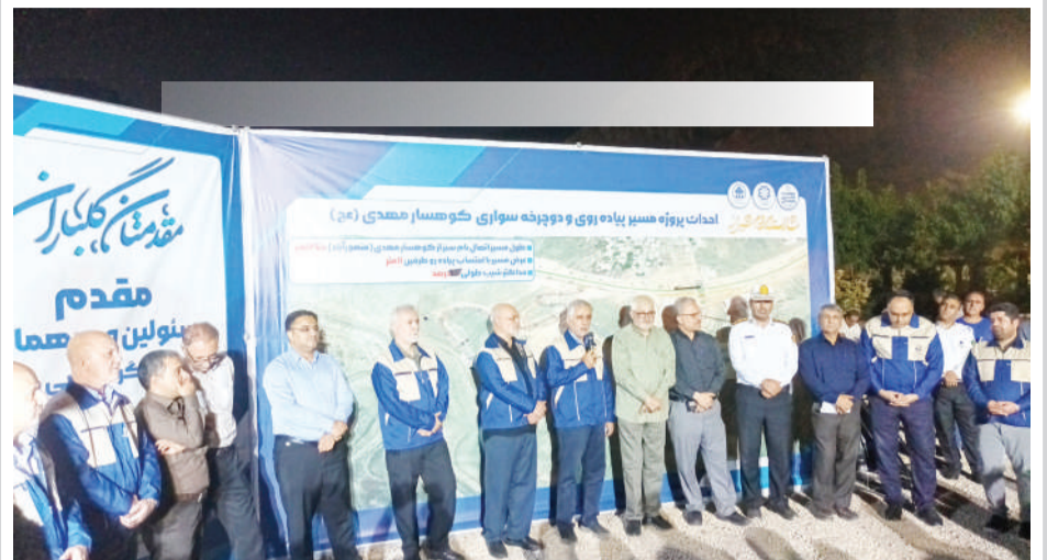
در هفدهمین بازدید مدیریت شهری شیراز و خبرنگاران از روند اجرای نوبت شب پروژه‌های عمرانی بزرگ مقیاس مطرح شد؛