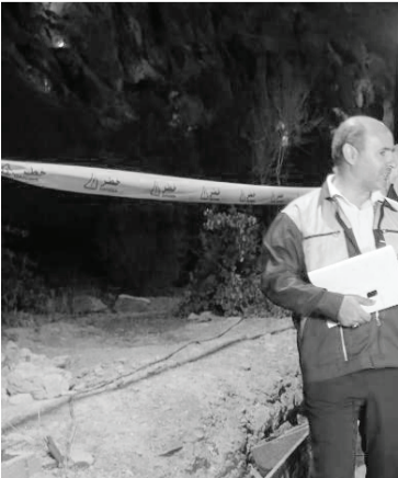
مدیر عالی پروژه مسیر پیاده‌روی و دوچرخه‌سواری کوهسار مهدی (عج)